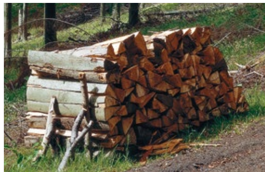
Chauffer avec des bûches de bois

Pour un grand confort de chauffage, l'allumage du combustible peut également se faire au moyen d'un dispositif automatique disponible en option et dont la puissance absorbée est de 300 W seulement. Il est possible de recharger la chaudière avec des bûches de bois alors qu'il n'y a pas encore de demande de chaleur. Dès que la température du réservoir tampon d'eau primaire ne suffit plus pour le chauffage ou la production d'eau chaude sanitaire, la chaudière s'allume automatiquement.