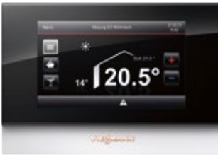
Commande à distance Vitotrol 350-C avec écran tactile.